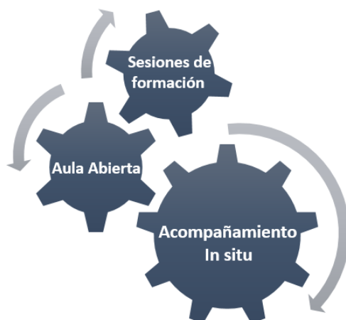
Gráfica 2 Escenarios de trabajo

Teniendo en cuenta los principios definidos y los objetivos propuestos se determinó una propuesta metodológica en la cual se definieron escenarios de trabajo con los docentes. Ver Gráfica 2.