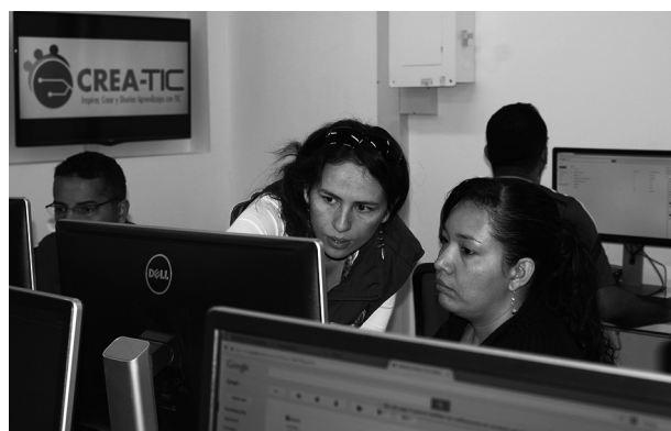
Capacitación de leader teachers en las instalaciones del CIER-SUR

• Formación: comprende el programa CREA-TIC cuya meta es la formación de 3.000 docentes o leader teachers orientados por dieciséis formadores master teachers y en la modalidad b-learning .