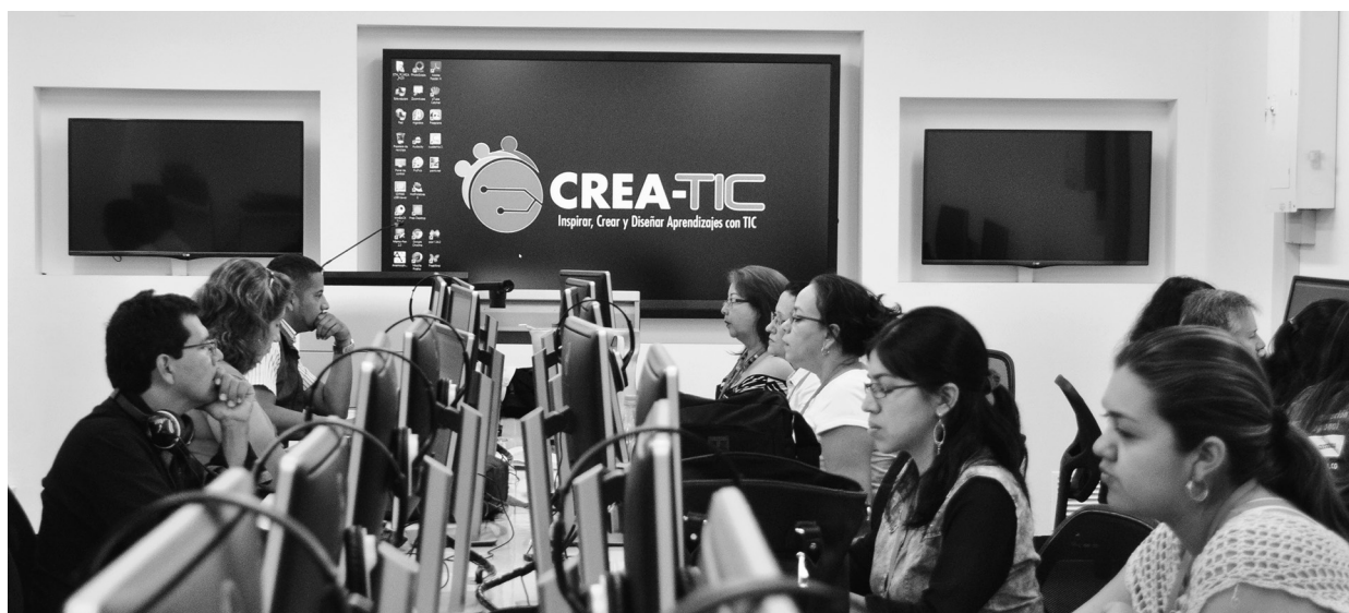
Profesores de la región reciben formación en el CIER-SUR

• Contenidos: consiste en el desarrollo de seis courseware (“Conjunto de unidades de aprendizaje digitales, dirigidas al logro de aprendizajes de un grado o nivel escolar” 1 ) en las áreas de lenguaje, matemáticas y ciencias naturales para los grados 10 y 11.